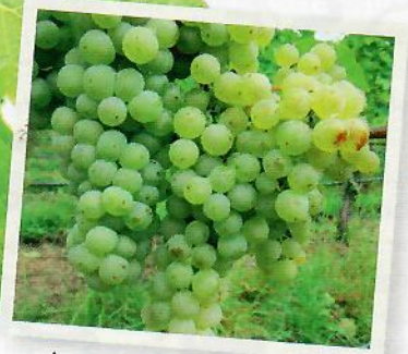
Die Temperatur während der Vegetation beeinflusst den Geschmack der Trauben.

W eißweine mit dem Namen Johanniter bringen Weinfreunde öfter mal mit der Unfallhilfe in Verbindung. In seltenen Fällen wird die Sorte auch für eine historische Rebsorte des ritterlichen Johanniter-Ordens gehalten.