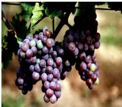
Rebsorte „Roter Riesling“

Durch regelmäßigen Einsatz der Mitglieder im Weinberg und Weinkeller wollen wir diese Ziele erreichen.