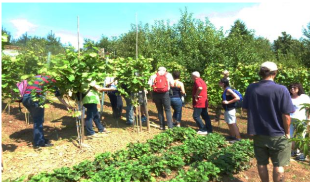
Besuch aus Geisenheim in einem unserer Weinberge